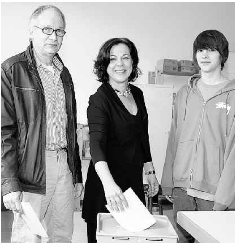
Die Landtagsabgeordnete Dr. Ruth Seidl von Bündnis 90 / Die Grünen bei der Stimmabgabe: Gemeinsam mit Ehemann Robert und Sohn Lukas ging sie in der Katholischen Grundschule Birgelen zur Wahl.

Linke 22/21. Stimmbezirk 10 Effeld Bürgerhaus: CDU 261/246, SPD 74/69, Grüne 41/43, FDP 17/23, Linke 24/22. Stimmbezirk 11 Birgelen Katholische Grundschule: CDU 116/104, SPD 80/82, Grüne 26/21, FDP 19/23, Linke 25/21. Stimmbezirk 12 Birgelen Katholische Grundschule: CDU 91/88, SPD 111/101, Grüne 31/27, FDP 13/12, Linke 19/21. Stimmbezirk 13 Birgelen Katholische Grundschule: CDU 145/140, SPD 79/69, Grüne 49/41, FDP 12/21, Linke 25/6. Stimmbezirk 14 Birgelen Katholische Grundschule: CDU 96/87, SPD 97/91, Grüne 44/38, FDP 19/22, Linke 28/21. Stimmbezirk 15 Myhl Katholische Grundschule: CDU 142/126, SPD 100/98, Grüne 25/24, FDP 15/21, Linke 17/13. Stimmbezirk 16 Myhl Katholische Grundschule: CDU 152/135, SPD 94/94, Grüne 33/27, FDP 13/20, Linke 22/25. Stimmbezirk 17 Myhl Katholische Grundschule: CDU 168/150, SPD 85/85, Grüne 26/20, FDP 16/20, Linke 21/20. Briefwähler: CDU 699/654, SPD 367/361, Grüne 190/141, FDP 74/107, Linke 101/86.